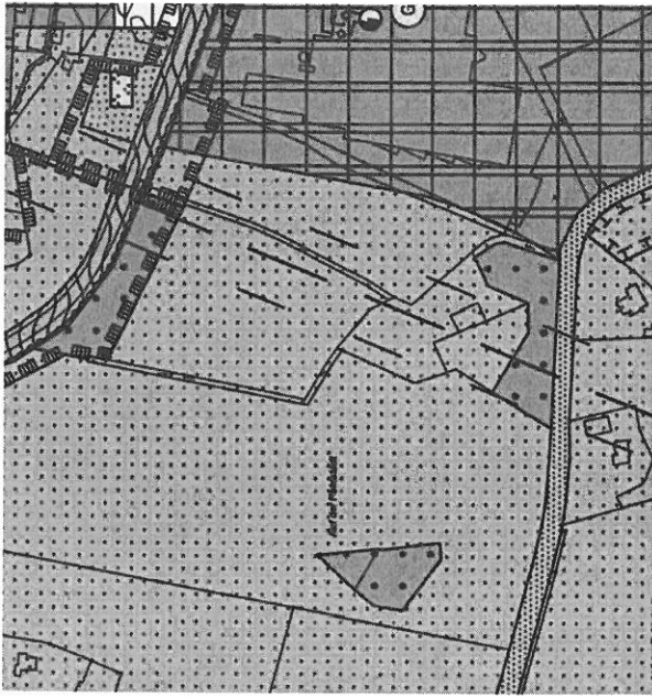
Auszug wirksamer FNP