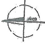
DETAILZEICHNUNG BEZIEHUNG M.1.1.1.2